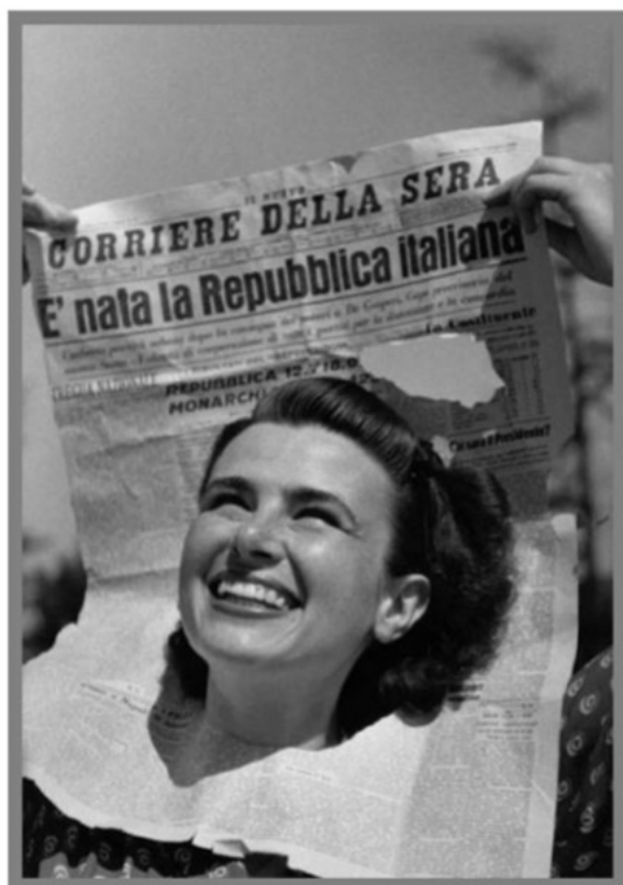
"È nata la Repubblica italiana". Immagine per la copertina di Tempo , n. 22, 15-22 giugno 1946