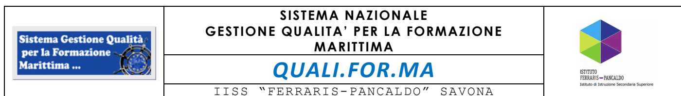
FIGURE DEL SISTEMA GESTIONE QUALITA'